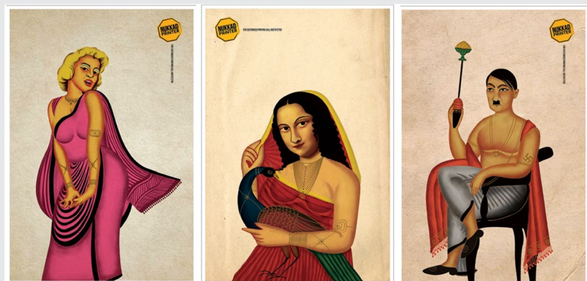
Ryc. 17 „Nukkad Printer”, 2017.