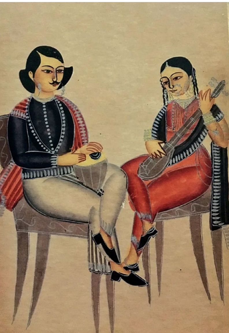
Ryc. 3 „Babu i Bibi”.