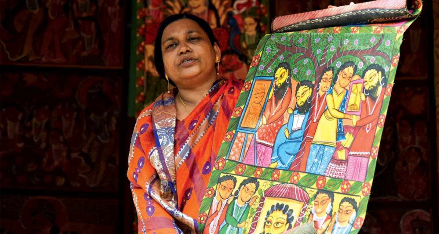
Ryc. 1 Patachitra z Pingli, Medinipur Zachodni.