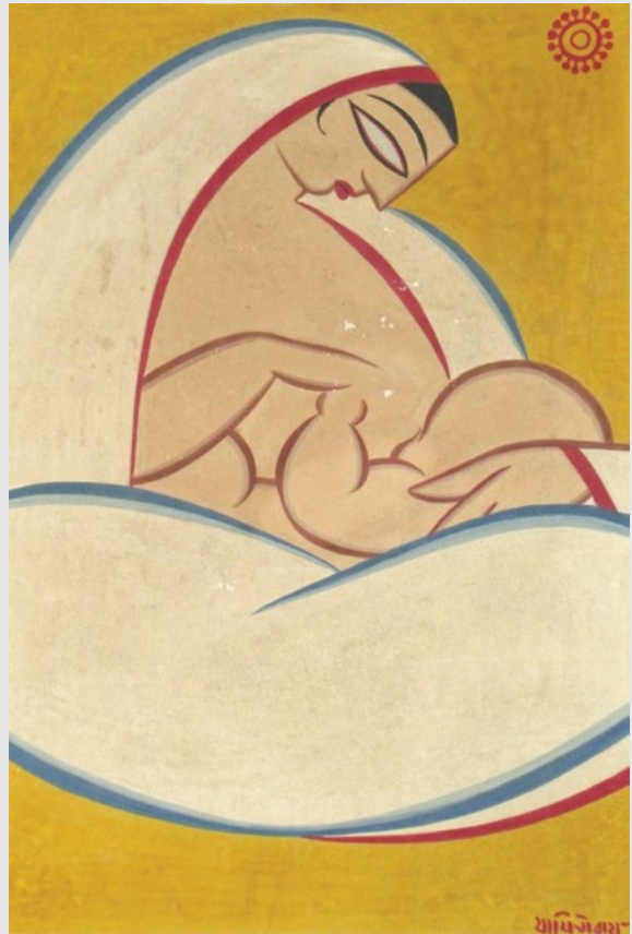
Ryc. 9 „Matka i dziecko”, Jamini Roy.