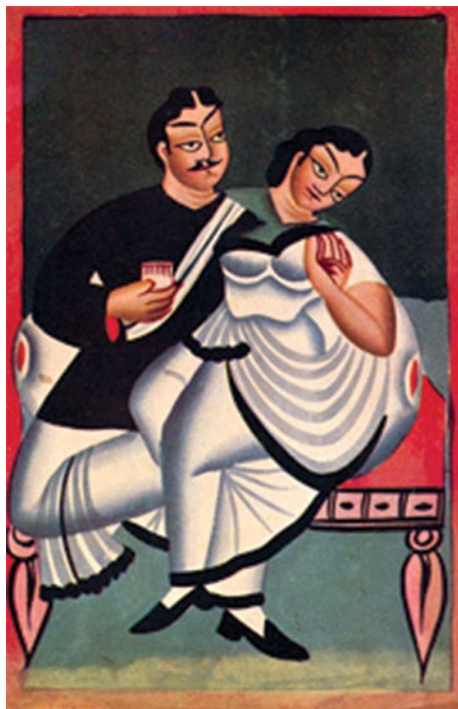
Ryc. 4 „Babu i Bibi”.