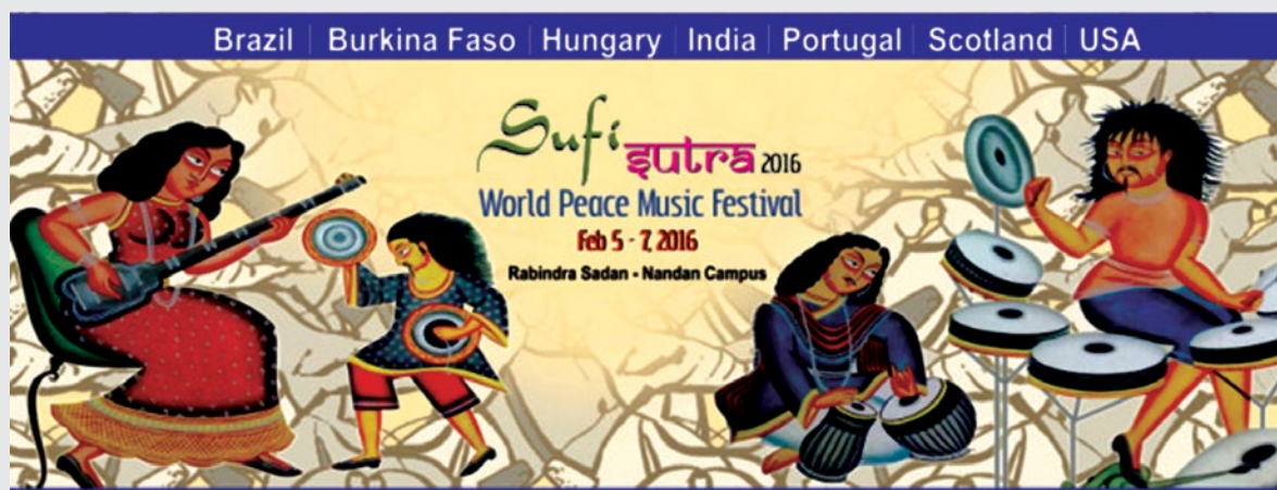
Ryc. 16 „Sufi Sutra”, 2016.

Przepis na ilish/hilse to jedna z popularnych potraw kuchni bengalskiej. Aby promować swój olej, Fortune Mustard Oil rozpoczyna Festiwal Ilish 2024 i tworzy specjalne opakowanie zatytułowane „Hilsa Special Pack”. W jednej z reklam Babu niesie rybę hilsa, a w innej Bibi gotuje hilse, a Babu pomaga jej dodać przyprawę (Ryc. 18).