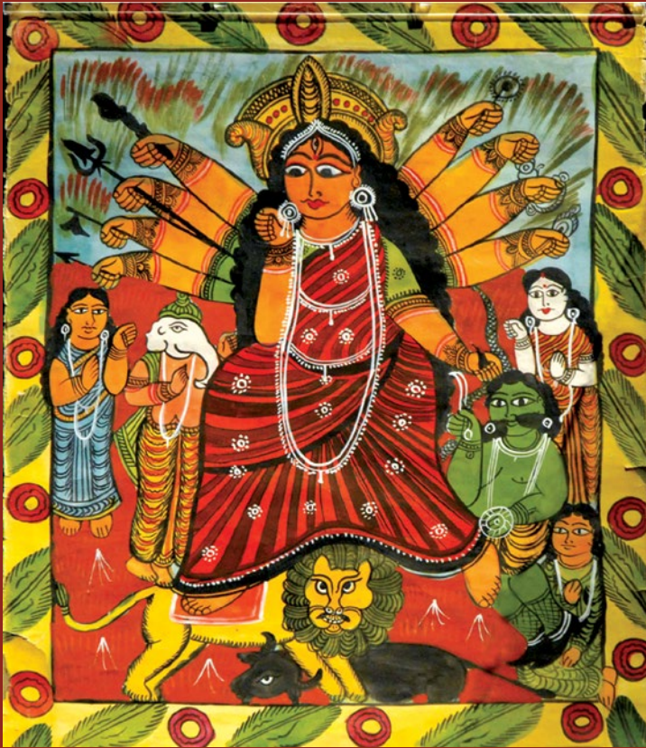
Ryc. 7 Patachitra z Pingli, Medinipur Zachodni.