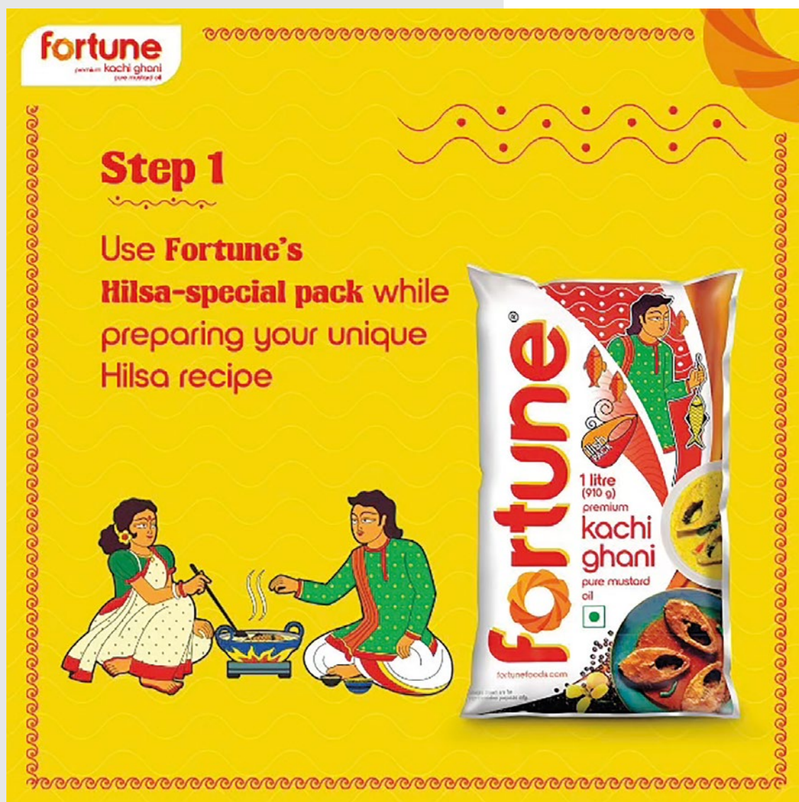
Ryc. 18 „Fortune Kachi Ghani”, 2024.