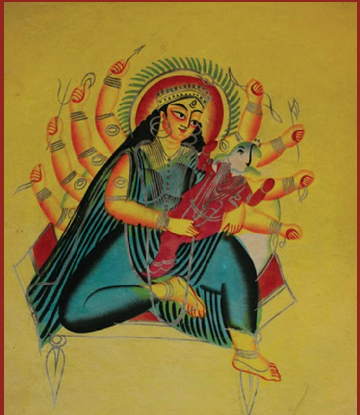
Ryc. 8 Patachitra z Kalighatu. Źródło: https://en.wikipedia.org/wiki/Kalighat_painting