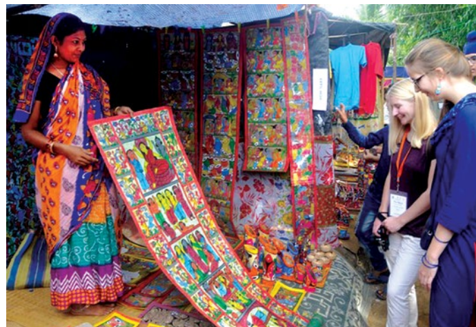
Ryc. 2 Wioska Pingla, Midnapur Zachodni.

tego stylu były wyraziste i liniowe kontury oraz płaskie nakładanie nieprzejrzystego koloru, tworzące efekt dwuwymiarowości i obejmujące dekoracyjną bordiurę. Pomiedzy końcem XIX a początkiem XX wieku tradycja Pingla Pat podupadła z powodu utraty mecenatu wiejskiego, masowej produkcji grafik i rozwijającego się rynku malarstwa Kalighat. Niestety, sam Kalighat Pat zaczął zanikać na początku XX wieku z powodu popular-