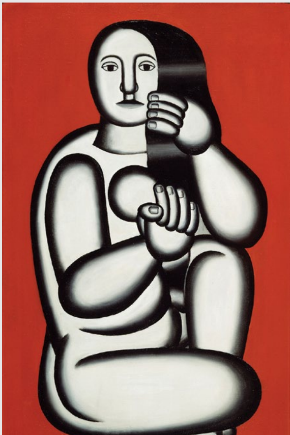
Ryc. 10 „Kobieta”, Fernand Léger.