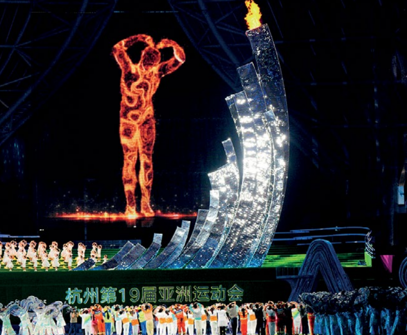
Ryc. 3 Cyfrowy biegacz z pochodnią podczas XIX Igrzysk Azjatyckich w Hangzhou zapala znicz i wyświetla cyfrowe fajerwerki (po lewej); cyfrowy biegacz wykonujący gest serca podczas ceremonii zamknięcia (po prawej).

tworzą więzi emocjonalne i sprzyjają głębszej identyfikacji z wartościami miasta, tym samym ożywiając jego wizerunek w świadomości publicznej.